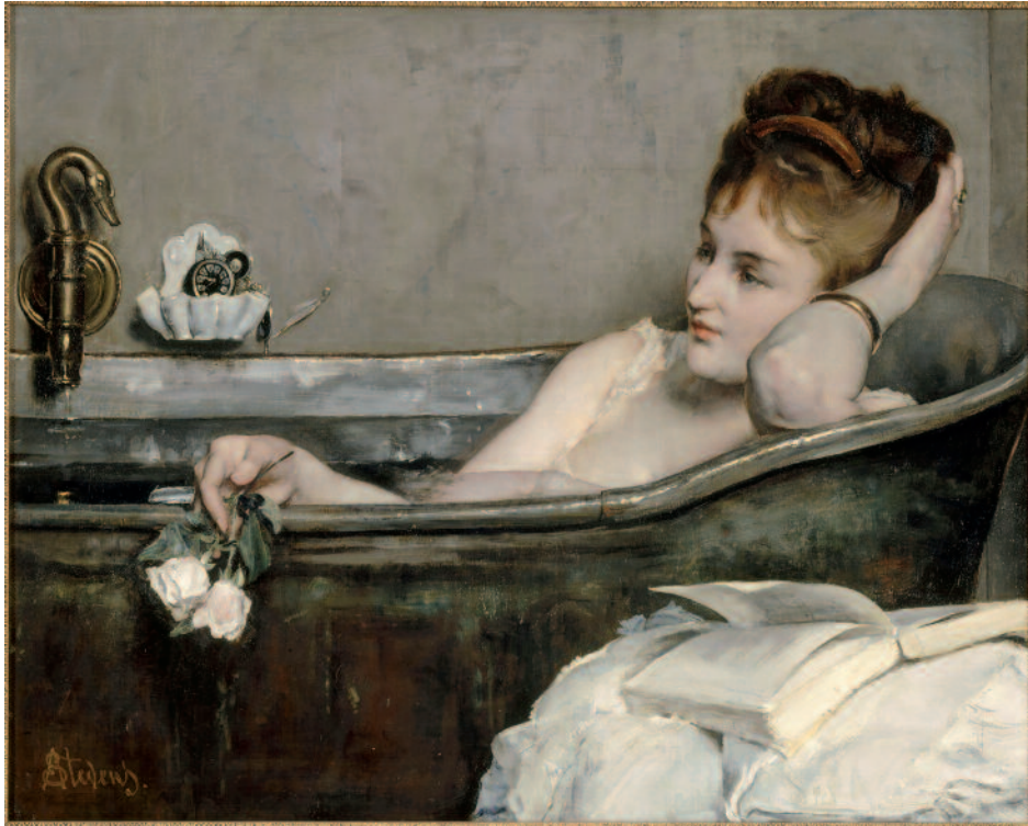
Le bain, dit aussi la femme au bain ou la baignoire vers 1867, Alfred Stevens